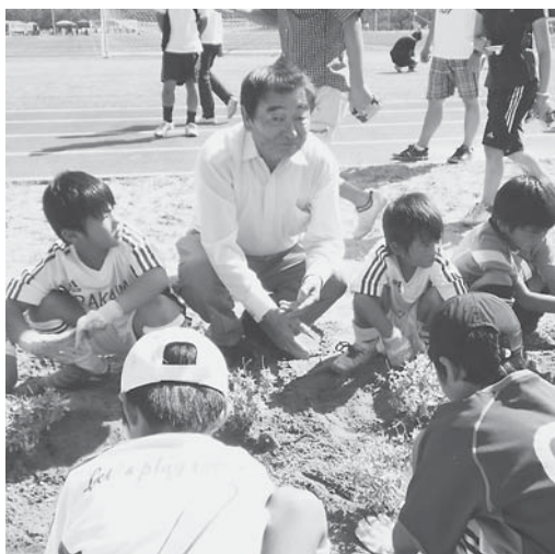
試合前にチェリーセージを植樹

KurucOキッズサッカーフェスティバルは、9月1日(土)、アルビレツジで開催されました。