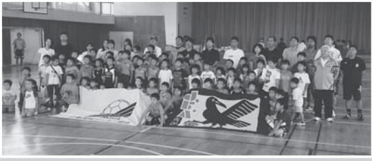
上越、中越地区は次号に掲載予定です。

今回の参加していただいた、お子様から、未来の新潟県の代表が、さらには日本代表が輩出されることを、期待せずにはいません。