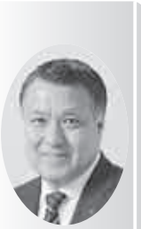
公益財団法人 日本サッカー協会 会長 田嶋 幸三